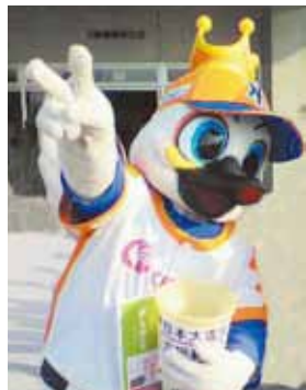
『応援隊長』 地元野球チームのマスコットキャラクター・アルファくん。いつも試合を盛り上げてくれます。仕草もとってもかわいくて癒されます。