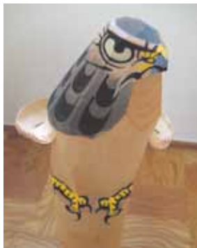
『お鷹ぼっぼ』 米沢に行った時、買ってきました。 我が家の床の間に置かれています。 とても癒されます。