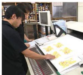
刷出しと色見本を比べて検討の様子