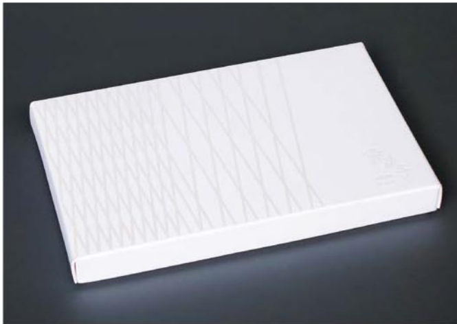
▲ふたを閉めたところ／線で作られた模様とロゴはパール箔を使用。角度によってもっと薄く見えたり、違った色味に見えたりします。