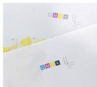
調整前(上)と後(下) 濃度が違います!