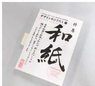
表紙も中身もすべて和紙です!