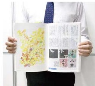
当社協力の紙面です。