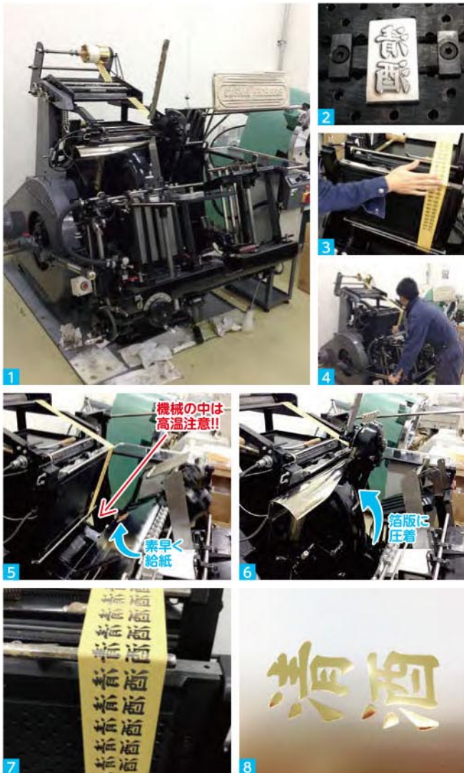
1 今回導入した新しい箔押し機 2 セットされた版(主にマグネシウムや銅製) 3 4 機械のセッティングをしているところ 5 機械の開いた様子 6 機械が閉じている(紙に圧着させている)様子 7 箔を押したあとのフィルム 8 箔押しされた用紙