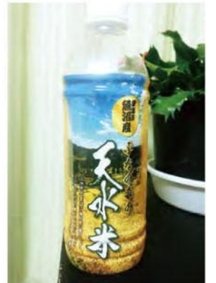
ちなみに後ろの穂木鉢は自宅の花です。いつまで枯れないで持ち帰るやら...全然関係ないですが(汗)

ちなみに、このラベルのシュリンクフィルムとペットボトルは当社で納めさせていただいております!