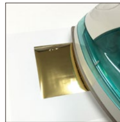
シワが寄らないよう、シートをぴんと張るのがコツ。