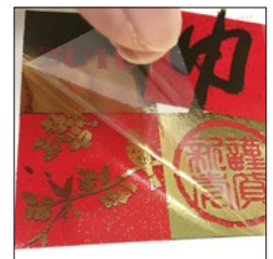
同様にアイロンを掛けて完成です!!