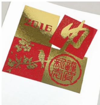
少しずれて、下地の黒が見えてしまいました(^-^;)