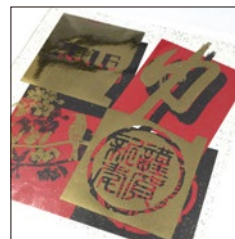
デザインをプリントした年賀状に、剥がした箔シートを乗せる。