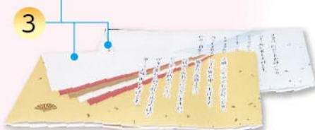
〈掛け紙〉POD(高速デジタル印刷機)で「銀奉書」に絵柄を裏刷りし、紙の風合いを生かしています。