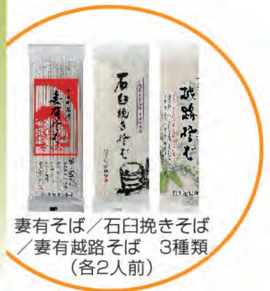
妻有そば／石臼挽きそば ／妻有越路そば 3種類 (各2人前)