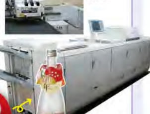
●オンデマンド印刷機(POD)