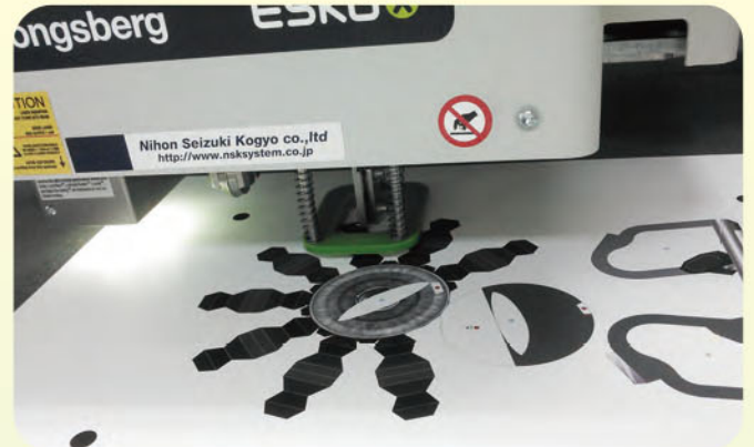
ようやく、カッターの出番。これはバイクのタイヤ部分の展開図。こ の通りジグザクも円弧もすいすいとカット。

今回は、先月に続いて展開図面データを作成を行い、そ して・・・待望の i-cut 機能を使ってパーツのカットです！！ (わくわく)