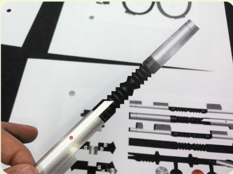
ぎざぎざのラインもこんなに綺麗にカットできました！