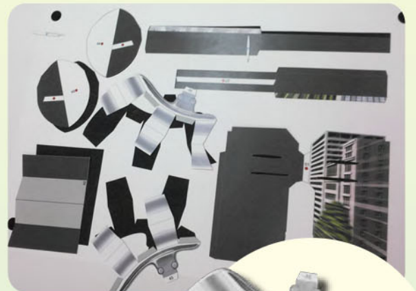
ちょっと変わった円弧が ある形も大丈夫です。