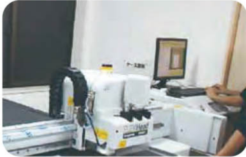
寡黙だが仕事が速く社内でも存在感たっぷり。

先月新しい仲間入りをし、ブログでもご紹介させていただきました、CAD マシンですが、「一体どんなことができるの？」という疑問になんとかお応えできないものだろうか、と悩んだ末・・・