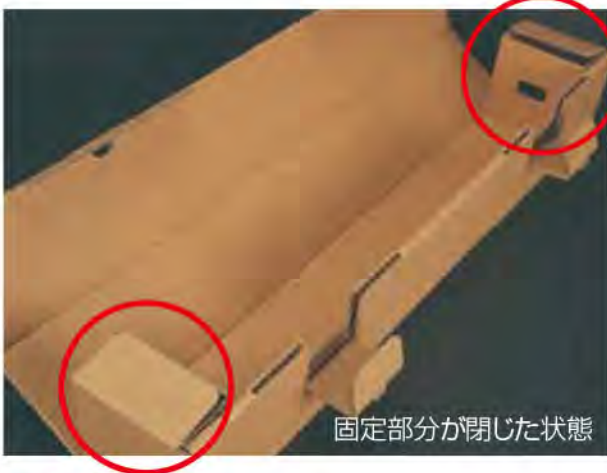
固定部分が閉じた状態