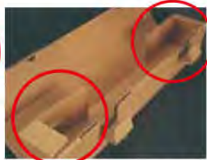
固定部分が開いた状態