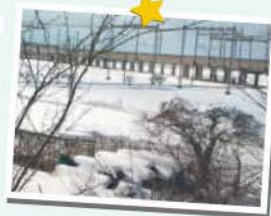
会社の窓から撮った風景です。寒いっ！

皆さん、こんにちは。いつもコマガタ通信をご愛読頂きましてありがとうございます。さて、新潟は連日の大雪で、朝から除雪車がせっせと道路の雪をどけて回っています。田舎の交通手段は主に車なので、本当に助かります！除雪車に感謝です。皆さんも、凍結した路面の運転や風邪などひかれませんよう、十分お気をつけてお過ごしください。