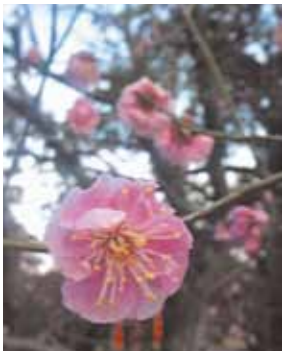
『モモの花』 投稿：渡辺

友人からの写メール。一足早い「春」が送られてきました。ここ最近、辛いニュースが多いですが、これを見て少し心が和みました。