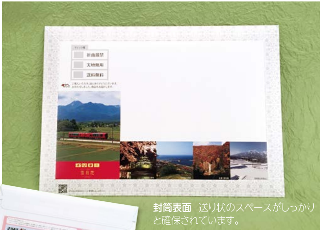
封筒表面 送り状のスペースがしっかりと確保されています。