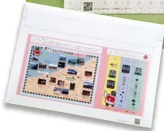
封筒裏面 写真がたくさんある路線図や、切り取ってしおりとして使えるデザイン入り。