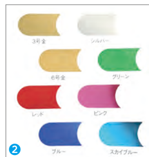
写真①:黒い紙に押しした箔が腐食して変色した様子。写真②:「絶縁箔」のカラーバリエーション。(写真のため実物と多少色が異なります。)

※箔以外の様々な要因でスパークが発生する可能性があります。事前に適正テストが必要な場合もございますので、詳しくはご相談ください。