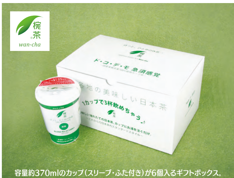
容量約370mlのカップ(スリーブ・ふた付き)が6個入るギフトボックス。