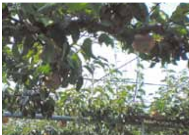
「なし狩り」

秋のフルーツ・梨を狩ってきました。みずみずしくて、とっても甘い!おいしかったです。