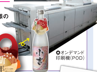
● オンデマンド 印刷機(POD)

小ロットや短納期といった、お客様 のご要望にお応えできる「ヒミツ」を、 実演で是非ご覧ください。