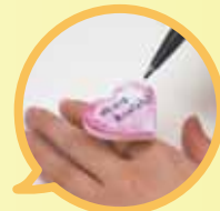
◀なんとリングの形をした付箋もありました!!