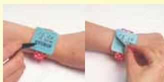
▲時間もメモ出来ます!

こちらの良い点は見た目だけでなく、手がふさがっている屋外での作業やイベント運営時などのデスクを離れた現場でもとても便利です。実用的でありながら、忙しい毎日に癒やしを与えてくれる付箋。今後も注目です☆ <渡辺>