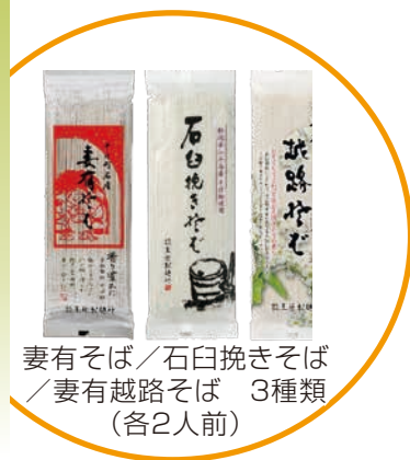
妻有そば／石臼挽きそば ／妻有越路そば 3種類 (各2人前)