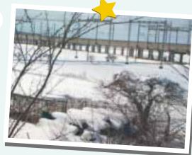
会社の窓から撮った風景です。寒いっ！

皆さん、こんにちは。いつもコマガタ通信をご愛読頂きましてありがとうございます。さて、新潟は連日の大雪で、朝から除雪車がせっせと道路の雪をどけて回っています。田舎の交通手段は主に車なので、本当に助かります！除雪車に感謝です。皆さんも、凍結した路面の運転や風邪などひかれませんよう、十分お気をつけてお過ごしください。